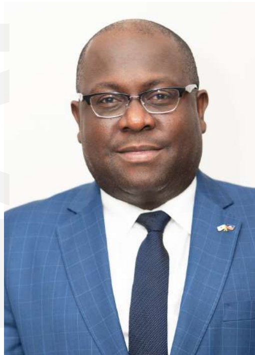
HELPH MONOD HONORAT

ハイチ共和国大使館 特命全権大使 エルフ・モノド・オノラ氏は、 2020年10月7日より、在日ハイ チ共和国特命全権大使として職 務に就任。これまで、2020年6 月から9月まで臨時代理大使、 2019年5月から2020年6月まで 同大使館次席公使を務めてきま した。神戸大学大学院経済学研 究科博士課程、カナダ・トロント 大学大学院公共政策学研究所 博士課程修了。