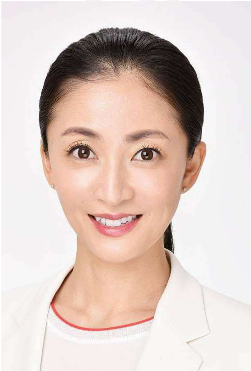
MC Aya Kawamura